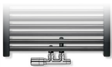
50 MM ZENTRALANSCHLUSS